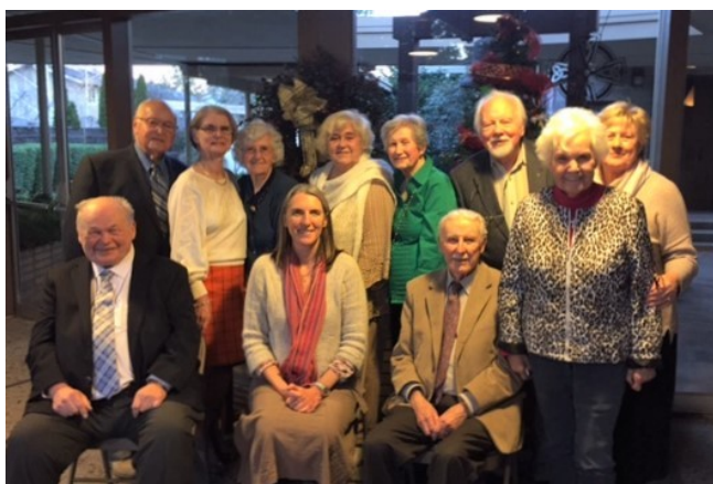
San Jose-Los Gatos kopas slēgšanas sapulces dalībnieki