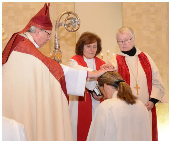
Ordinācija 2014.g. 24.oktobrī

Kad atgriezos studēt Oksfordā, es satiku savu tagadējo vīru un mēs salaulājāmies Rofantā, namā, kas pieder Londonas latviešu draudzei, jo tā bija man svarīga dzīves sastāvdaļa laikā, kuru pavadīju Anglijā. Kopš tā laika mūsu ģimene ir sekojusi vīra darbam akadēmiskajā laukā, kas mūs aizveda uz Keiptaunu Dienvidāfrikā un pēc tam atveda uz Ziemeļkaliforniju, kur viņš sāka strādāt Lawrence Berkeley Laboratories . Manu ikdienu aizņēma un vēl arvien galvenokārt aizņem mūsu trīs bērnu audzināšana.