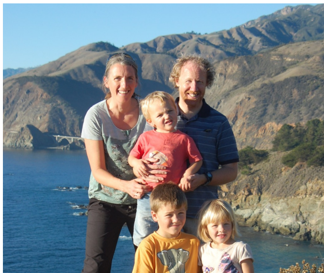
Ar ģimeni pagājušā gada novembrī

Man vienmēr ir bijis svarīgi piederēt kādai draudzei un tikai īpašos gadījumos svētdienās neesmu baznīcā. Kopš iesāku studijas ārpus Latvijas, esmu visbiežāk apmeklējis anglikāņu draudzes un arī šobrīd piederu episkopāļu draudzei. Tomēr arī latviešu luterāņu draudzēs vienmēr esmu jutusies kā mājās. Tā nu ir interesanti sagadīties, ka, kamēr episkopāļu baznīcā šobrīd vēl pārbaudu savu aicinājumu uz priesterību, latviešu baznīcā man jau ir dota iespēja kalpot.