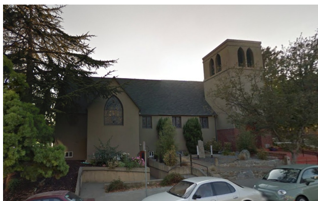
Oaklandes Augšāmcēlšanās baznīca, kur notika draudzes pēdējais dievkalpojums 2014.g. 23.decembrī