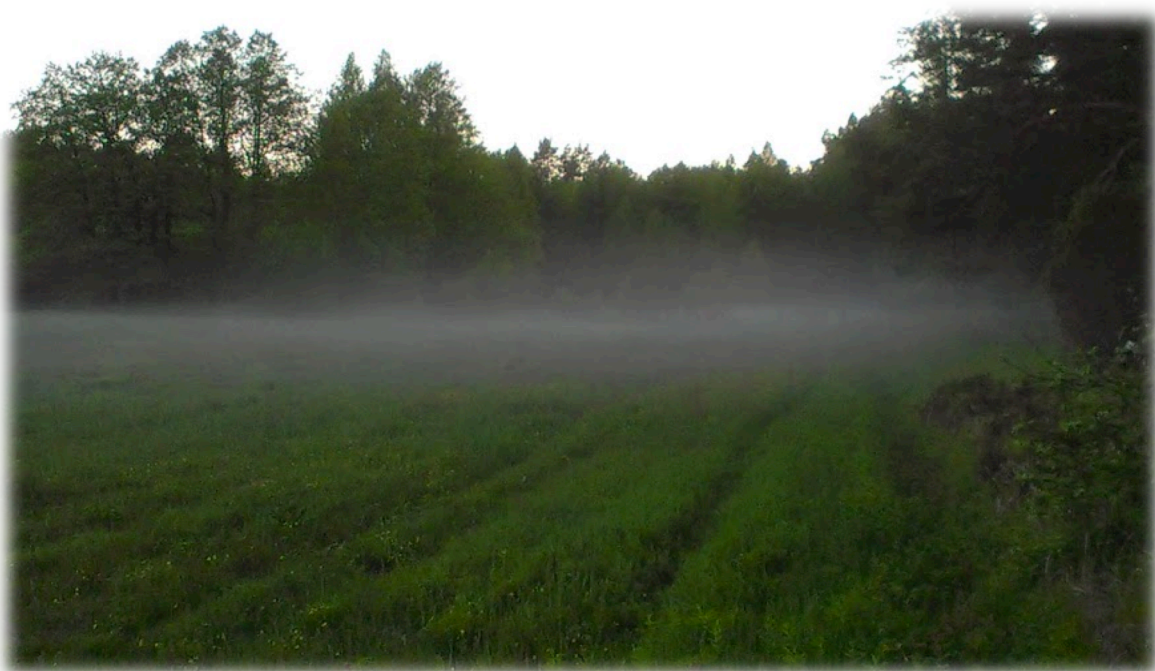
Vakara noskaņa Kurzemes mežmalā maija beigās