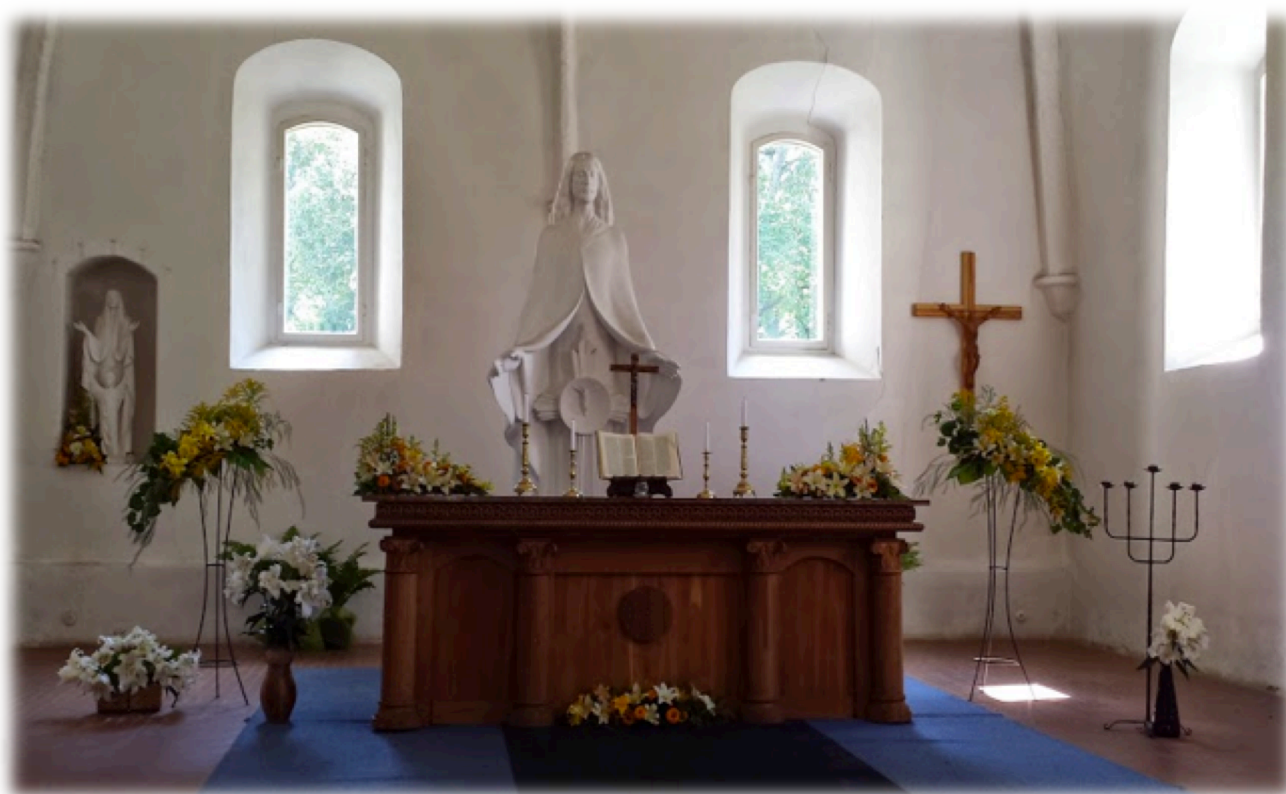
Krimuldas baznīcā šajā vasarā

ZIEMEĻKALIFORNIJAS LATVIEŠU LUTERĀŅU DRAUDZES IZDEVUMS