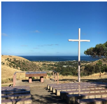
Brīvdabas baznīca Austrālijas latviešu izglītības centrā 'Dzintari,'