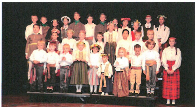
Latviešu skolas koris