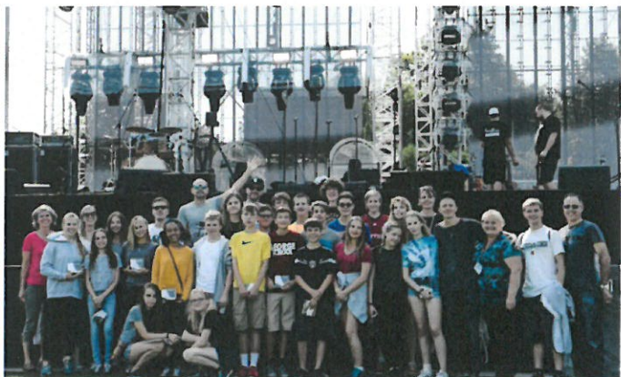
“Sveika Latvija” grupa “Prāta vētra” koncertā Liepājā