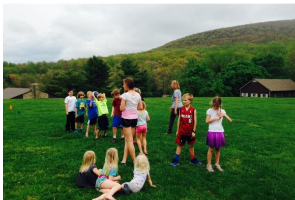
Skolas bērni Kalngala nometnē