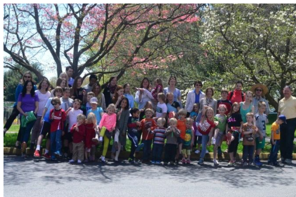
„Pricīgo pēdu” brašie soļotāji