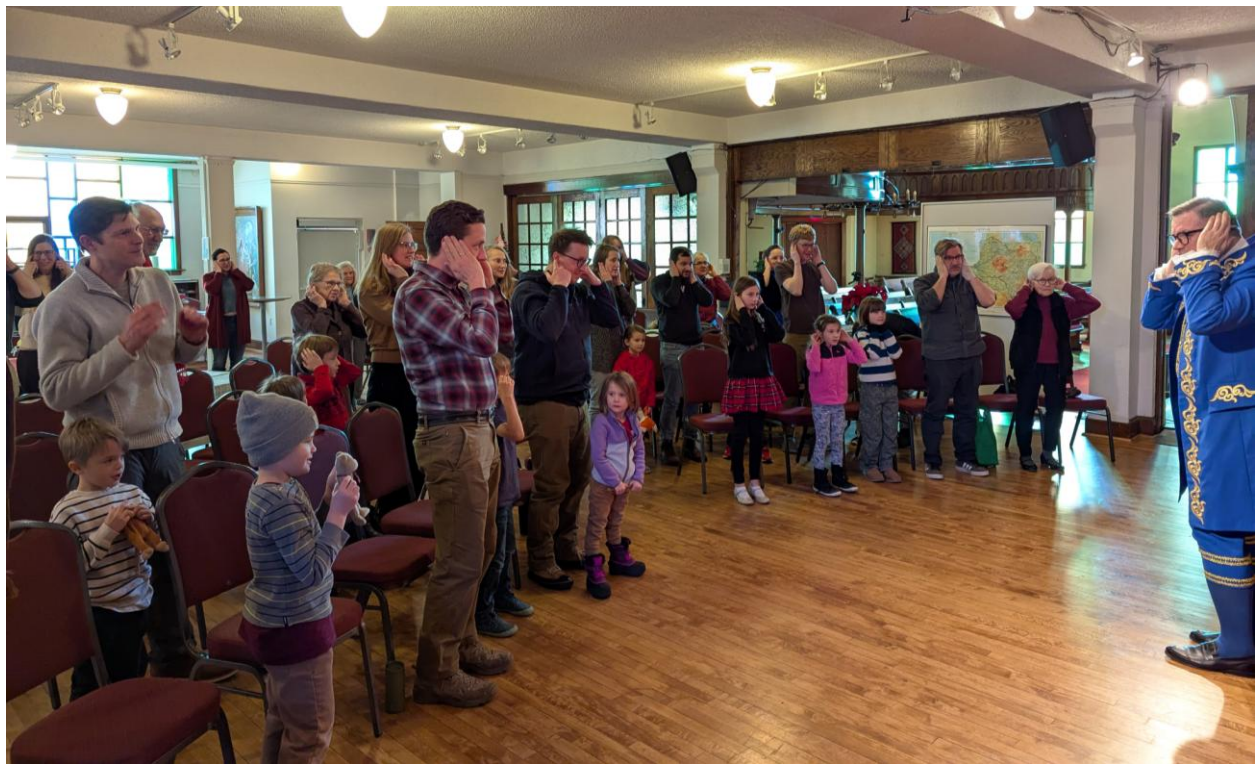
Raitis izkustināja gan bērnus, gan vecākus, gan vecvecākus.