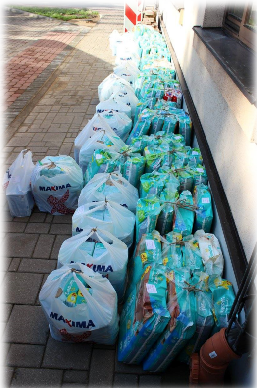
Autiņi pirms izdales Bauskā.