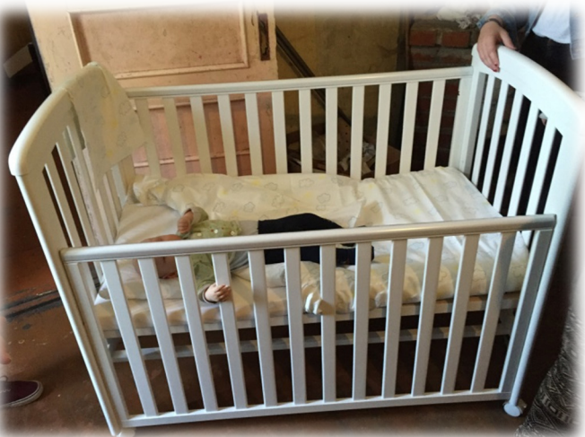
Viena no 48 skaistām Latvijas bērza koka gultiņām, kas ražotas Latvijā.