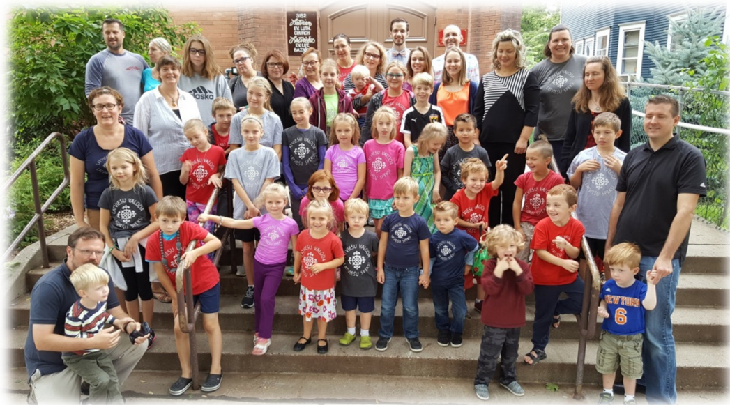
Skolas saime 17. septembrī.