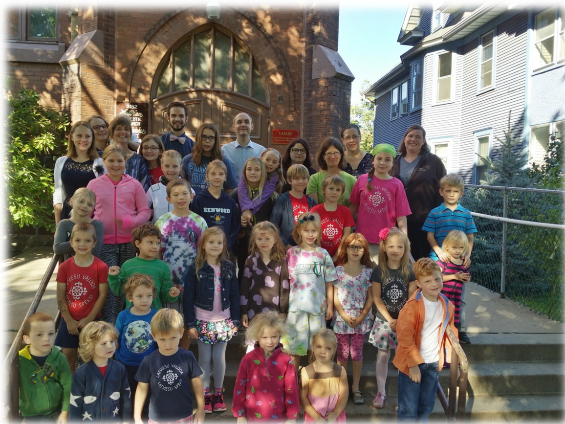
Skolas saime 19. septembrī.