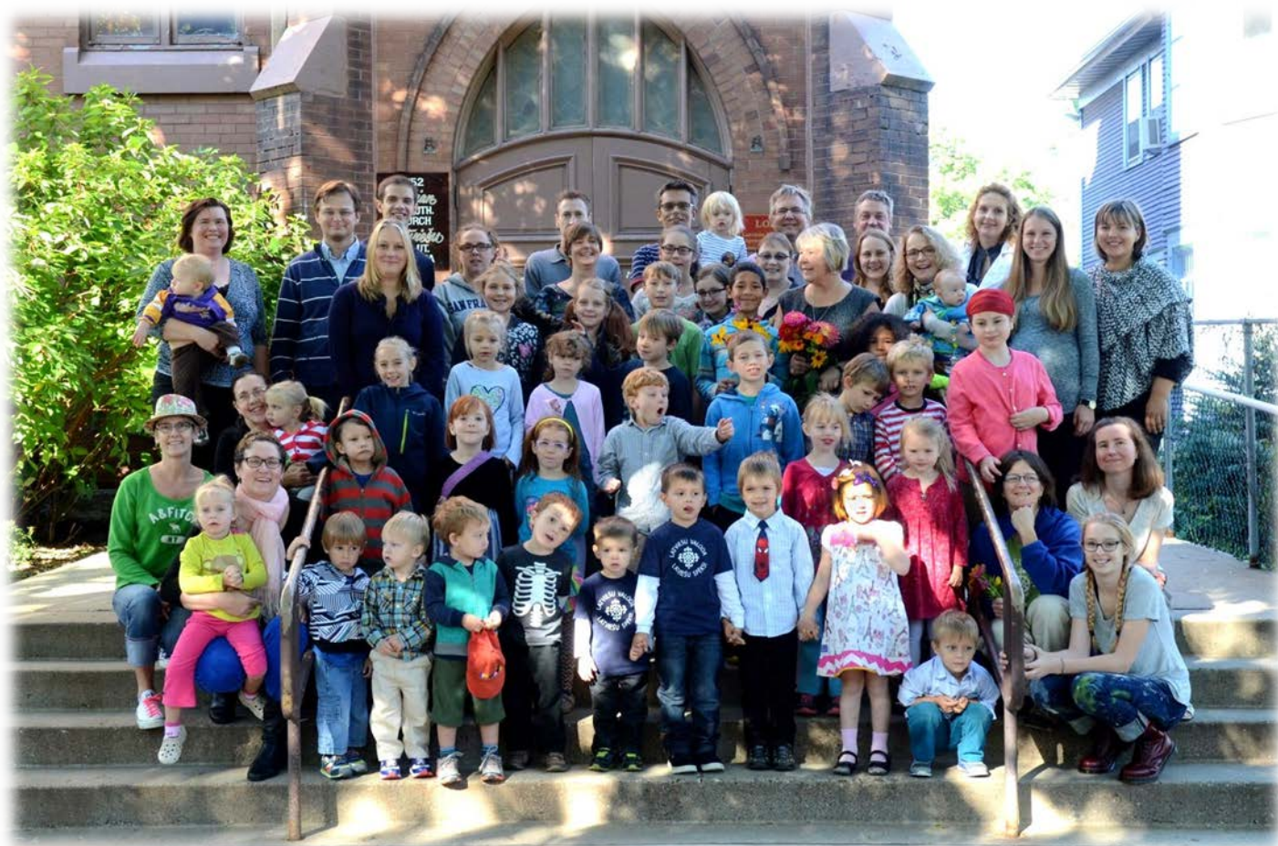
Latviešu skolas saime pirmajā skolas dienā 13. septembrī!

Mineapoles/St. Paulas latviešu skola jauno mācību gadu uzsāk kuplā pulkā - pavisam kopā 39 bērni (daži no viņiem neapmeklē skolu katru sestdienu, bet turpina mācības mājās). Vislielākā ir bērnudārza klasīte, kurai šogad piepulcējās 5 zēni. Kopumā klasē mācās 11 bērnu, no kuriem tikai 2 ir meitenes. Klasi māca sk. Kira Birmanis un sk. Lilita Rubenzere. 1. klasē mācās 7 skolēni (6 meitenes un 1 zēns). Klasi vada sk. Ingrīda Erdmane. 2. klasē arī ir 7 skolēni. Klasi vada sk. Kristīne Girbe un sk. Edija Banka-Demandta. Sk. Intas Lāčplēses vadītājā 4. klasē mācās 5 bērni. Vecākajā, 5./6. klasē, mācās 4 skolēni. Klasi vada sk. Āva Bērziņa. Valodu klasītē pie sk. Jāņa Baroba un sk. Anjas Čuriskis latviešu valodu apgūst 5 bērni. Dejošanas stundas vada sk. Ingrīda Erdmane un sk. Laima Dinglija. Dziedāšanu māca Dr. Benjamiņš Aļļe. Viņš šogad arī uzņēmie mācīt literatūru vecākai klasei. Koklēšanu māca sk. Nora Lunda. Šogad kokli sāks mācīties arī 4. klases bērni. Rotaļas visai skolas saimei vada sk. Zinta Pone. Māc. Dāgs Demandts uzrunā skolas saimi rīta uzrunas laikā, kā arī māca Ētikas/Ticības priekšmetu. Skolā palīdz arī bijušās absolventes Marita Pelēce un Amēlija Lāčplēse. Esam pateicīgi visiem skolotājiem par ziedoto laiku un uzņēmību, mācot skolas bērnus! Paldies vecākiem, kas turpina bērnus vest uz skolu apgūt latviskās zināšanas! Skola laipni gaida visus skolas pasākumos - nāciet ciemos jau