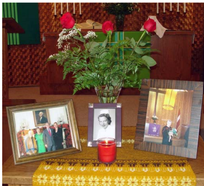
Piemīņas svētbrīdis 2014.g.16.februārī Sv.Pēterā baznīcā

Jēzus Kristus saka: „Patiesi, patiesi es jums saku: kas manus vārdus dzird un tic viņam, kas mani ir sūtījis, tam ir mūžīgā dzīvība un tas nenāk tiesā, bet no nāves ir pārgājis dzīvībā.” (Jņ 5:24)