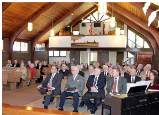
Draudze 19.janvāra dievkalpojumā