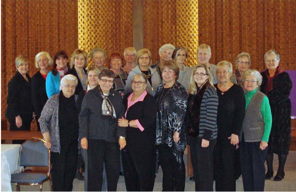
Draudzes dāmu komitejas pilnsapulces dalībnieces.