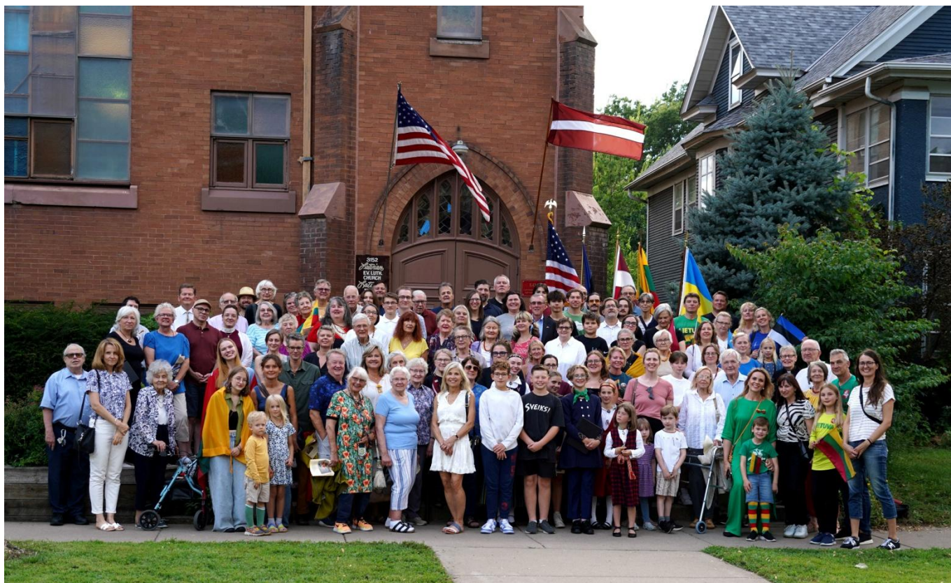
Baltijas ceļa atceres dalībnieki.

Sekoja azaidis baznīcas lejas stāvā, kuru Dāmu saime bija ziedojusi. Kas vēlējās, varēja atstāt ziedojumu "Protez Foundation" par labu ukraiņu karā cietušajiem. Patīkamā gaisotnē klausījāmies, kā arī dziedājām, visu trīs valstu tautas dziesmas un populāro baltiešu dziesmu trīs valodās, "Atmosfēra Baltija." Fotografijas no 1989. gada Baltijas ceļa un 30 gadu atceres 2019. gadā Mineapolē tika rādītas video aparātā.