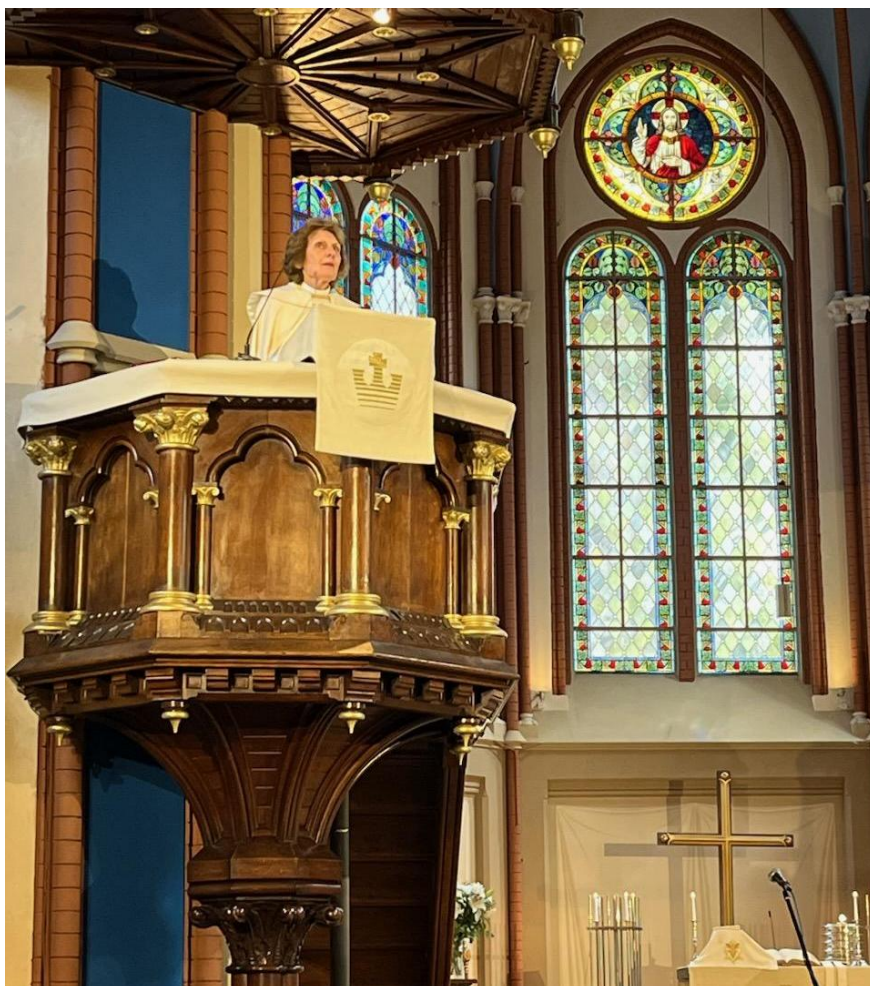
Archibīskape Lauma Zušēvica sprediķo Dziesmu svētku dievkalpojumā.