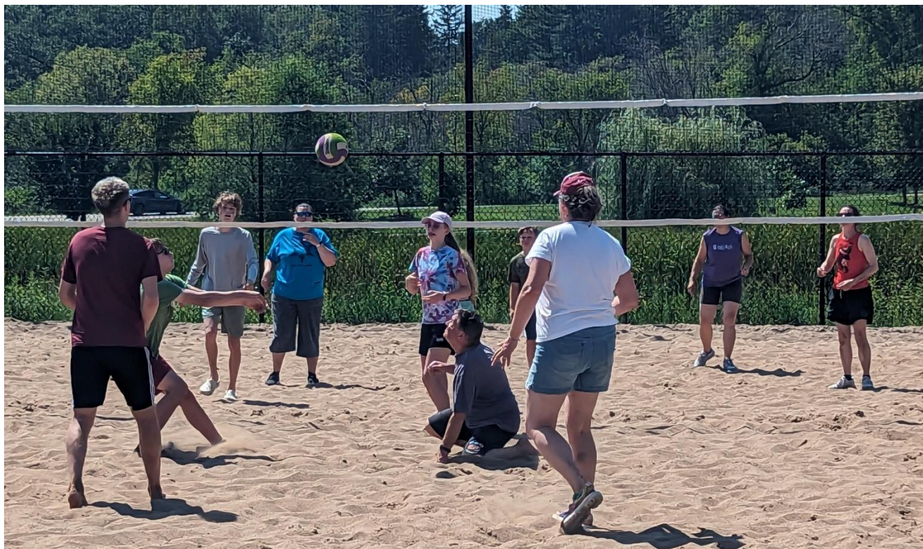
Aizrautīgas spēles moments.

Īpaši jauki, ka starp spēlētājiem bija daudz jauniešu!