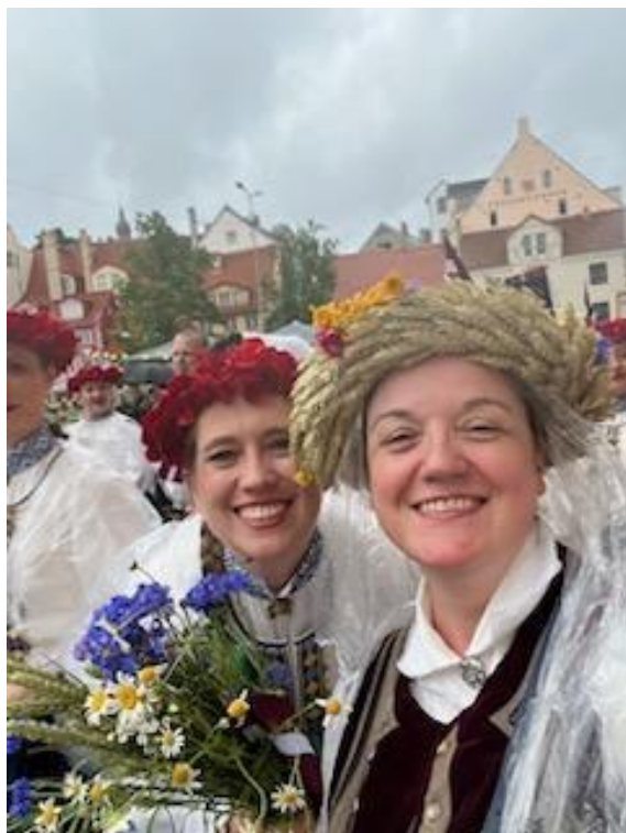
Mineapolieši Dziesmu Svētkos!