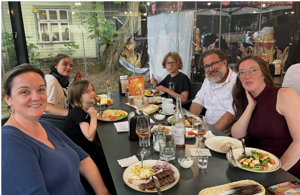
Parīzes lidostā nejauši satikām Skujiņu ģimeni un sarunājām iet vakariņās Jūrmalā!