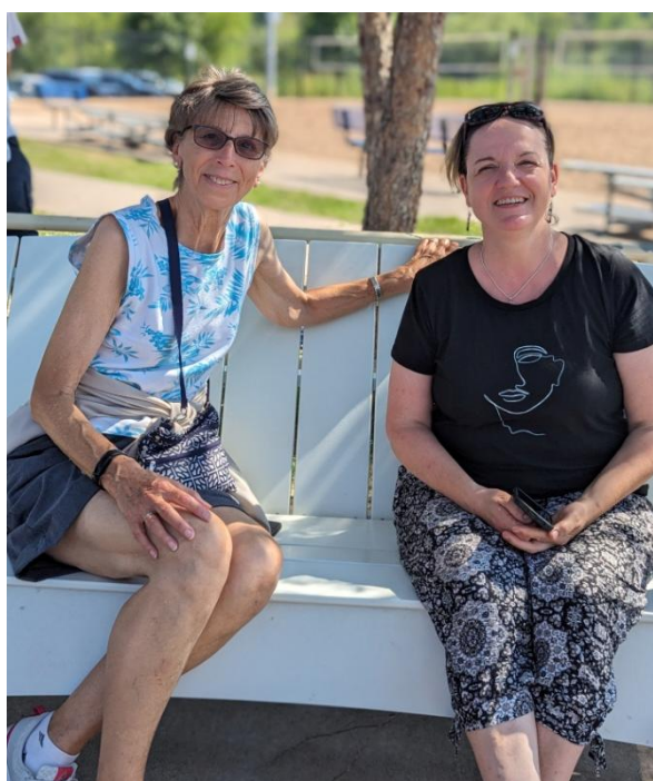
Atnākušie skatītāji pavadīja laiku jaukās sarunās!