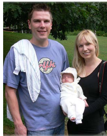
Laimīgā Braunu ģimene + + +