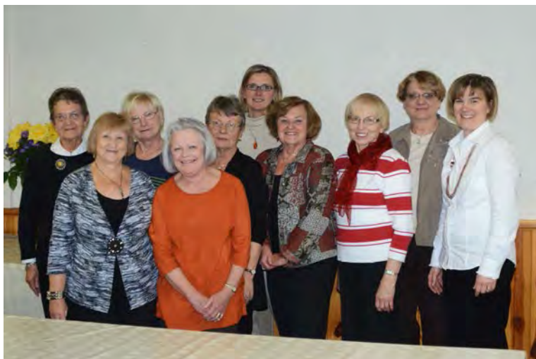
Dāmas, kas sagatavoja siltās pusdienas