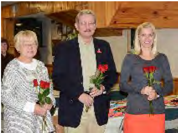
Novembra saieta jubilāri