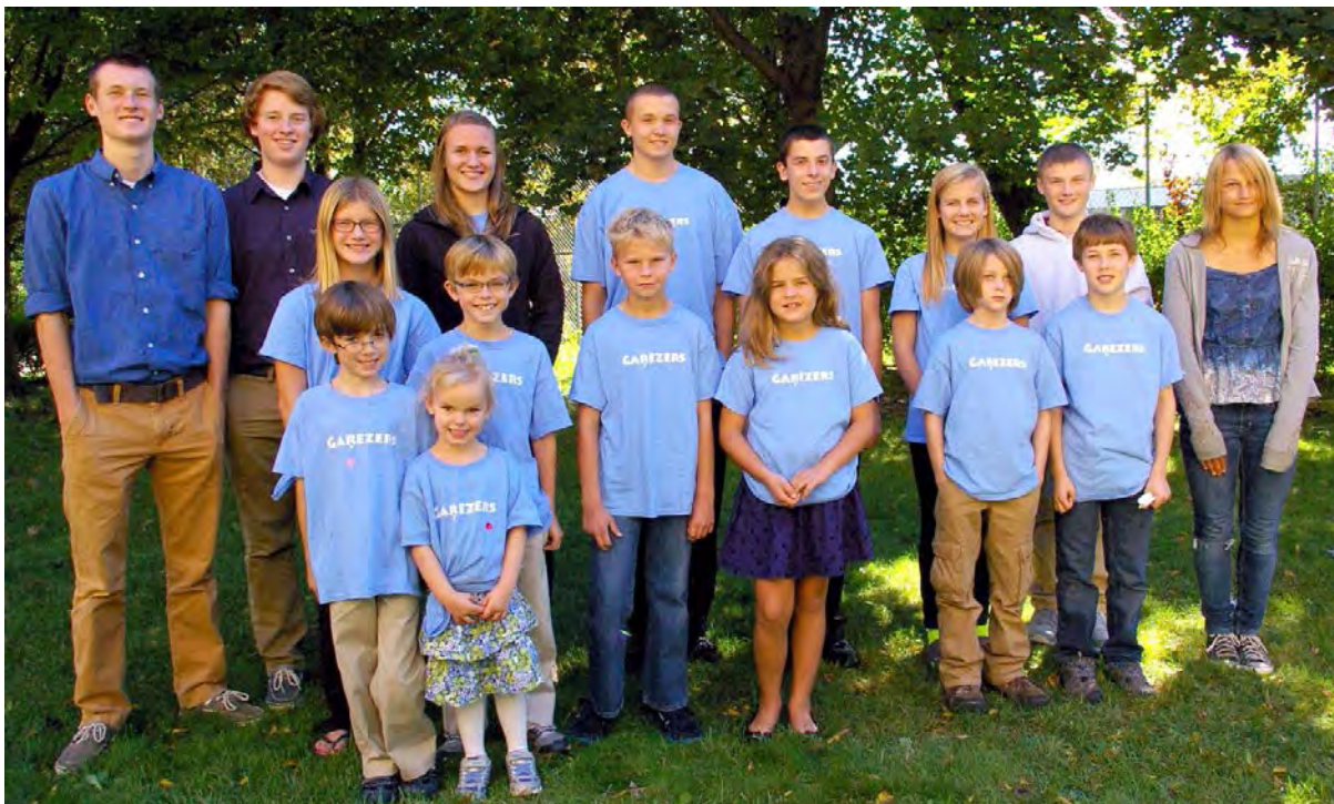
Šīs vasaras Garezera un “Sveika, Latvija!” dalībnieki pateicas Milvoku draudzei, Daugavas Vanagiem un vietējai sabiedrībai par atbalstu.