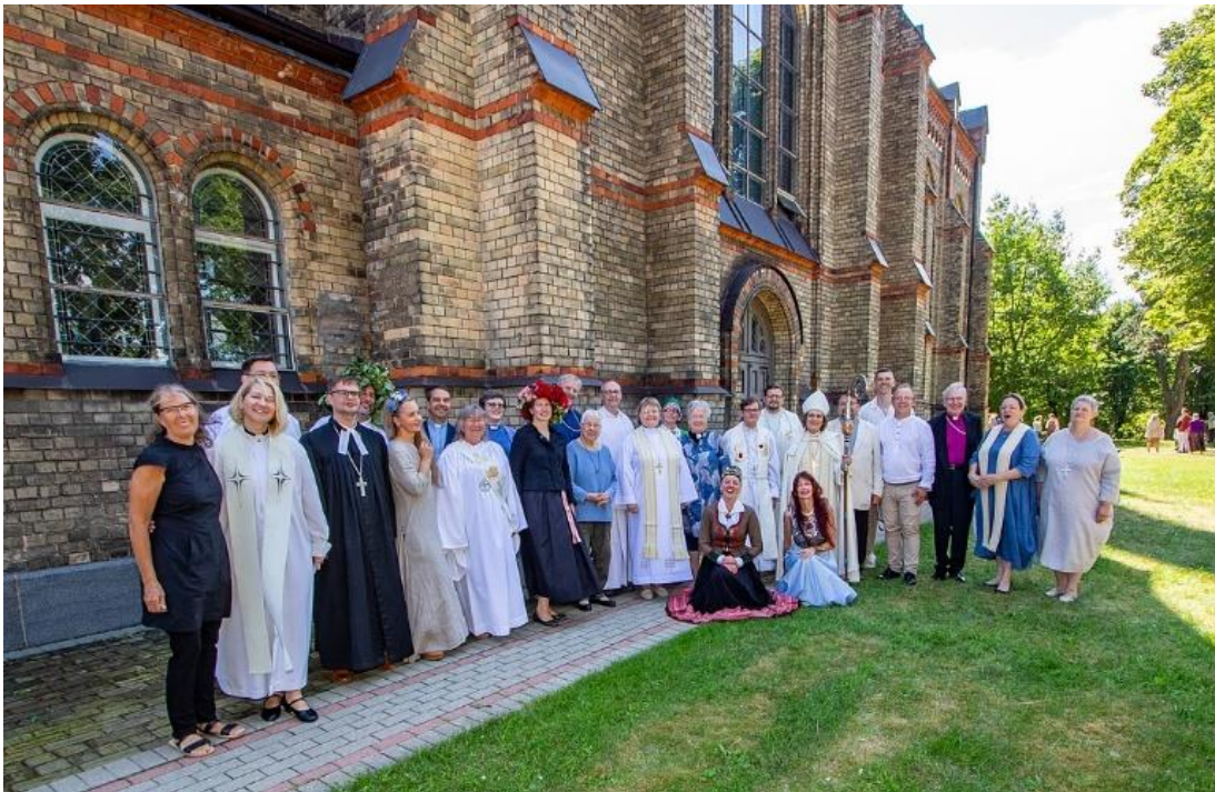
LELBA Pasaulē draudžu garīdznieki pēc dievkalpojuma