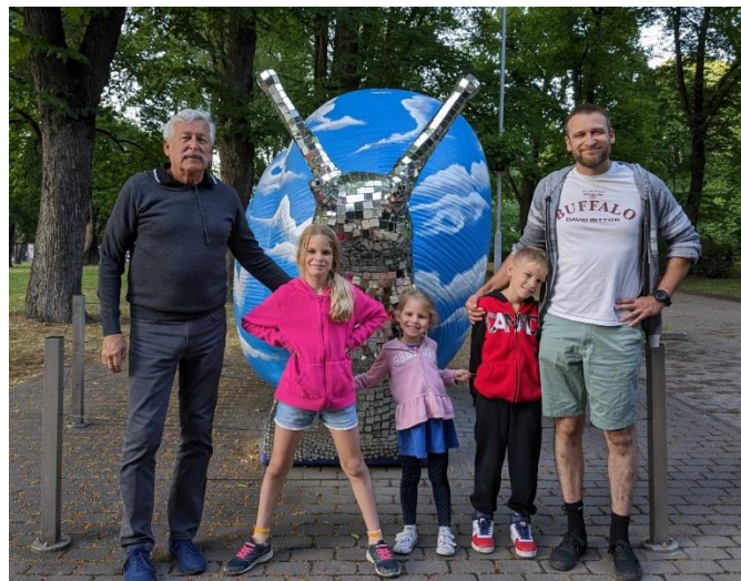
Kronvalda parkā pie slavenā zilā gliemeža