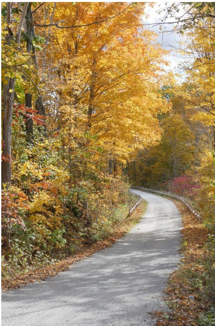
Tryon Road, Sharbot Lake