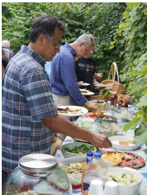
Kā allaž piknika galds bija bagātīgi klāts visām gaumēm