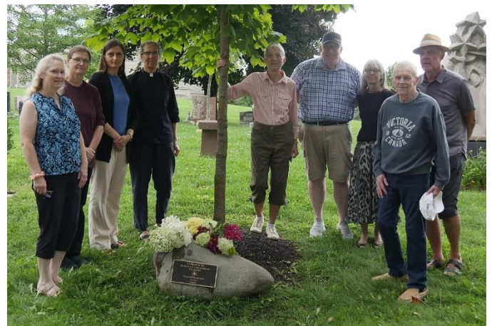
Pirms došanās mājās, vairāki piestājās pie Otavas Miera draudzes locekļu piemiņas akmens

Šogad Beechwood kapsētas 150. gadu pastāvēšanas jubilejā ir uzstādīt plakāti ar 150 bildēm gar ieliņas malu otrā kapsētas galā. Pārsteidzoši ir, ka viena no tām ir bilde no mūsu kapu svētkiem lapenē.