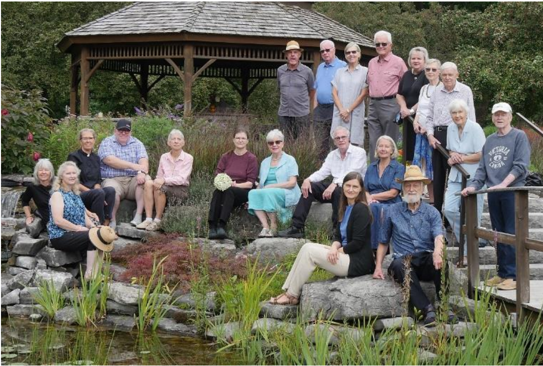
Mūsu tradicionālā kopbilde pie dīķa

Šogad rīta svētbrīdī Beechwood kapsētā piedalījās mazāk cilvēku kā iepriekšējā gadā. Viena daļa no draudzes bija aizbraukuši uz savām vasarnīcām. Cits pievienojies aizgājēju pulkam.