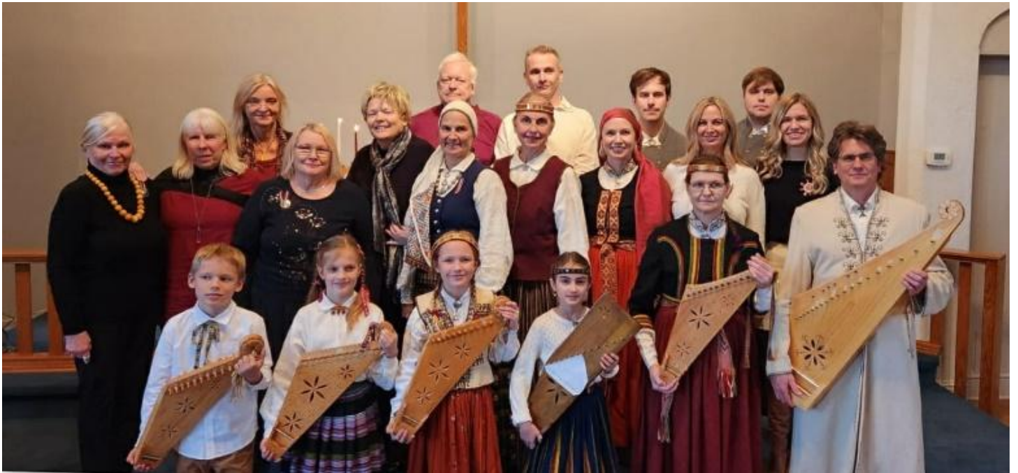
Viena daļa no kora ATBALSS ar koklētājiem.