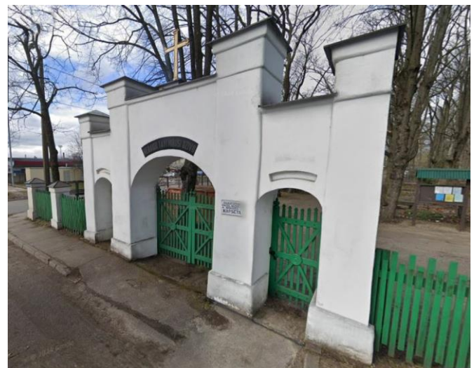
Zīme uz Daugavgrīvas Baltās baznīcas draudzes kapsētas vārtiem "NERAUDI, TAVI MIRUŠI DŽĪVO"

Laiks bija patīkami silts, bet tumši mākoņi draudēja ar lietu; tomēr tikai mazliet uzsmidzināja pa svētbrīža laiku un piestājās, kamēr uzņēmu kopbildi.