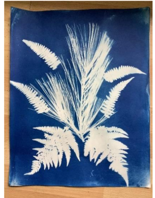
I. Mazutes saules druka

Māksla ir izveidot kompozīciju no jebkādiem priekšmetiem (3x3 lietoja dabas materiālus - lapas, ziedus, utt). Tos uzliek uz cianotipa (cyanotype) papīra un liek saules gaismā 2 minūtes. Pēc tam papīru labi noskalo, un, kad izžūst, māksla gatava!