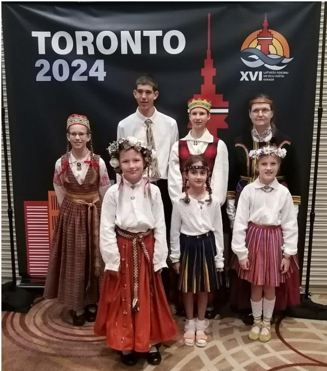
Otavas skolas koklētāji pie Toronto stenda

Otavas skolas bērniem bija tas gods piedalīties kopā ar pārējiem koklētājiem no Toronto XVI Dziesmu un Deju svētku 2024 atklāšanas koncertā, 4.jūlijā Sheraton viesnīcā. Daudziem no bērniem šī bija pirmā reize spēlēt tik lielai publikai. No sirds pateicamies skolotājai Mārai Zariņai par sniegto atbalstu Otavas skolas bērniem un ceram uz turpmāku sadarbību un koncertiem.