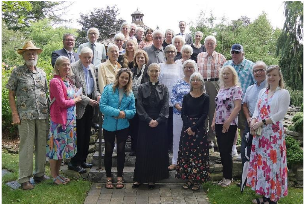
Mūsu tradicionāla kopbildē pie trepēm aiz nojumes

"NERAUDI, TAVI MIRUŠI DŽĪVO". Vienmēr kādi pārsteigumi - tā ir tā pati kapsēta, kur manu vecāku Latvijas radi ir apglabāti. Es biju cerējis, ka es atradīšu savā foto kolekcijā no braucieniem uz Latviju vienu foto no kapsētas vārtiem, bet bija tikai bildes no radu kapu vietām. Bet šodien mēs varam apbrīnojami daudzus skatus atrast otrā pasaules pusē ar Google Maps , lietojot Street View .