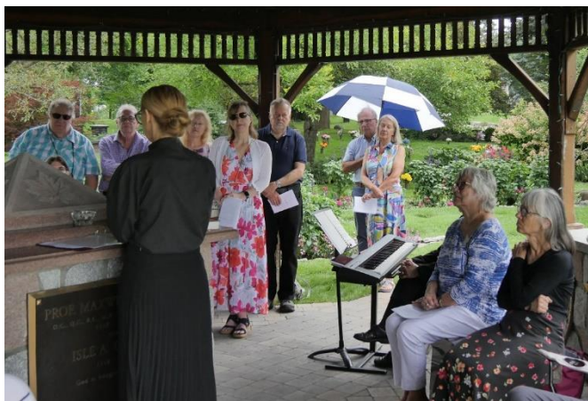
Zem nojumes un lietussarga