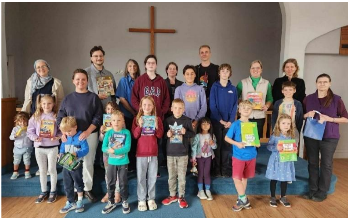
Skolēni ar skolotājiem skolas sākumā