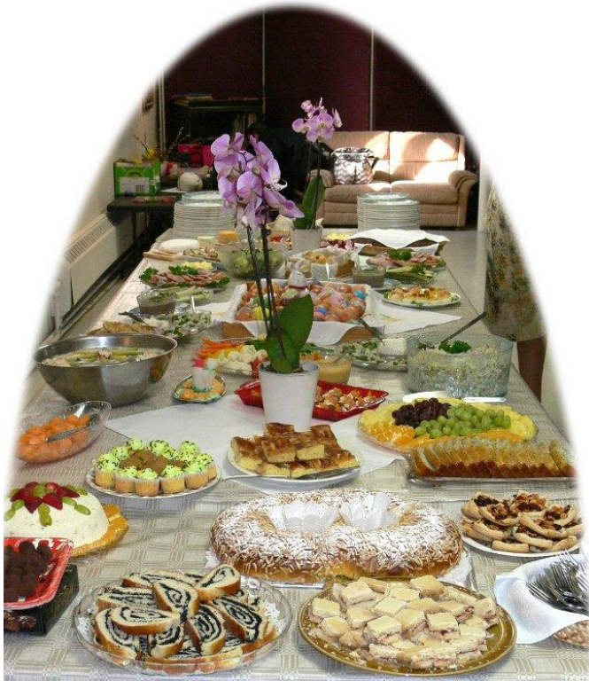
Lieldienu svinību galds