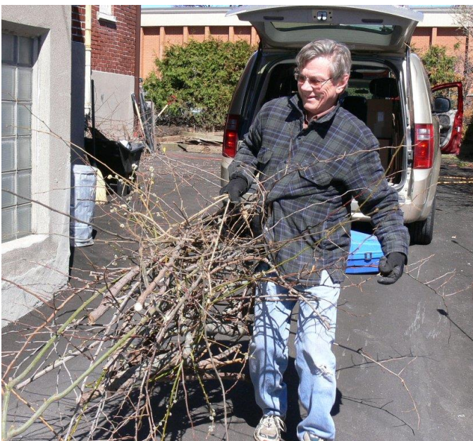
Vai Pēteris būvēs ērgļu ligzdu?