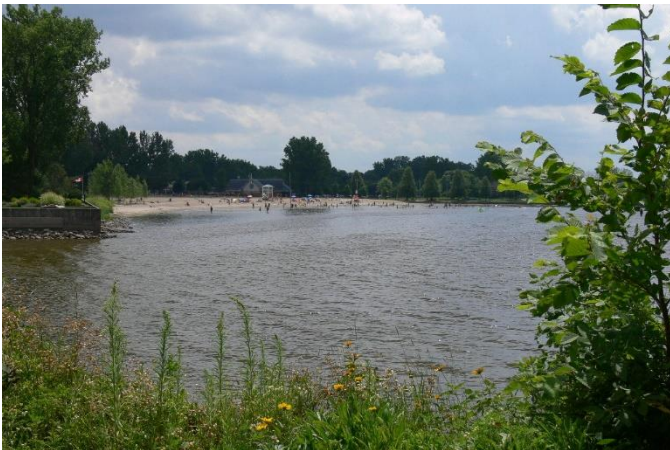
Skats no piknika galda uz Britannia līci

19. jūlijā pulcējamies Sīpoliņu ģimenes īpašumā Britannia, Otavas upes krastā. Diena bija saulaina un silta, kad apsēdamies kuplas kļavas ēnā, no kurienes varējām redzēt, kā upē mirgoja ūdens.