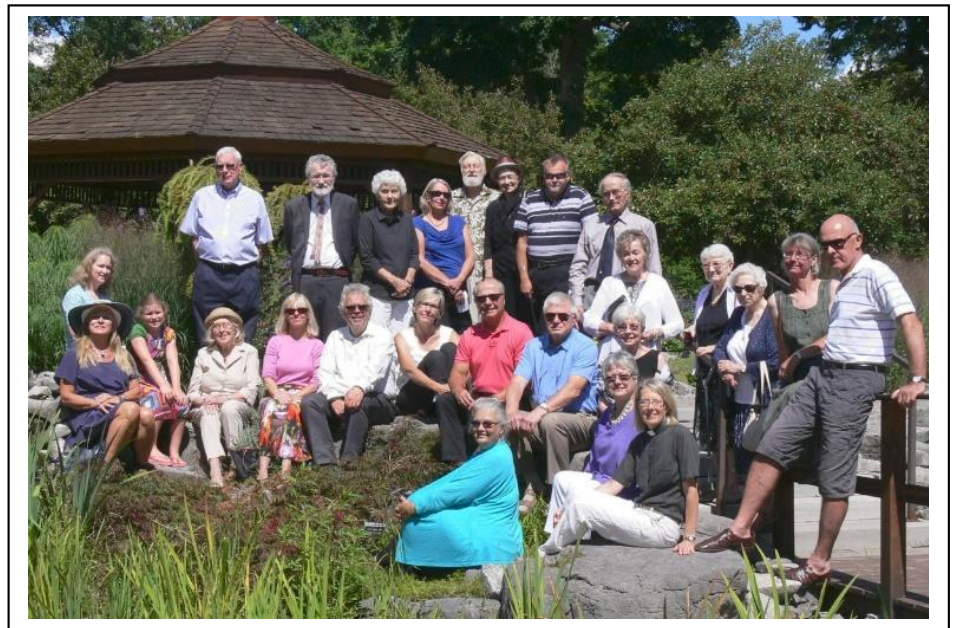
Kopbilde pie Beechwood dīķīša