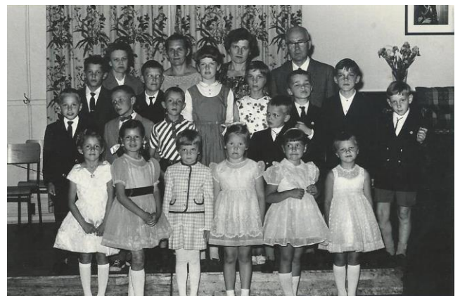
Otavas latviešu skola 1962. gada pavasarī