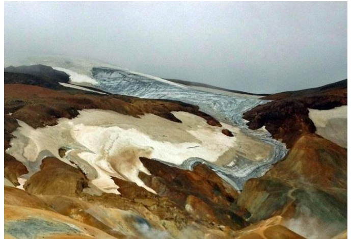
Islandes iekšzemes šļūdonis Kerlingarfjoll izskatās tāpat kā glezna

Islandi redzēt. Paldies Ingai par interesanto priekšlasījumu.