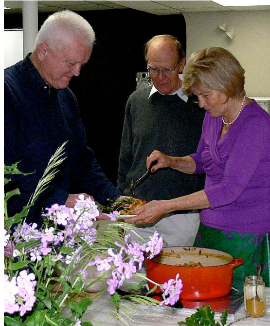
50 gadu jubilejas svinībām Montreālā un par ligošanu Tērvetē 2012. gadā. Mēģinājām