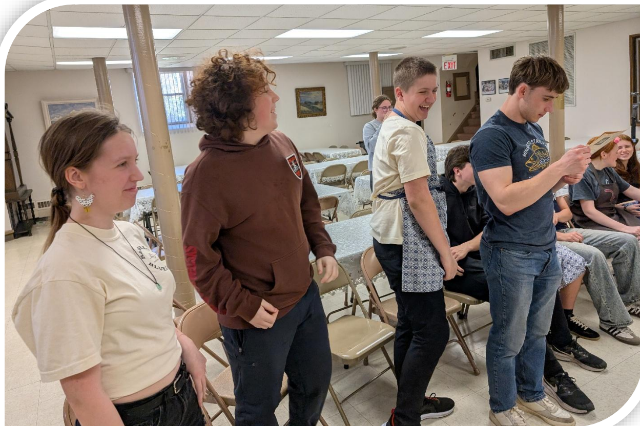
Priecīgie konkursa uzvarētāji