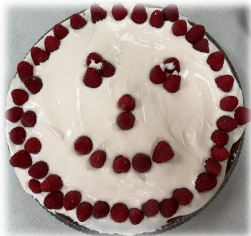
Garšīgā un smaidīgā uzvarētāja medus kūka.