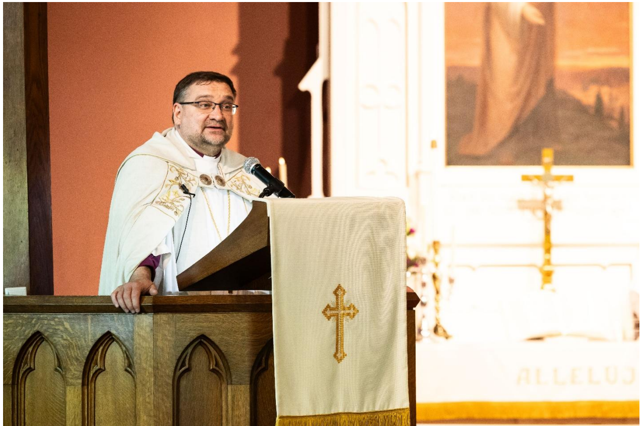
Sprediķis, apsveikumi, uzruna.