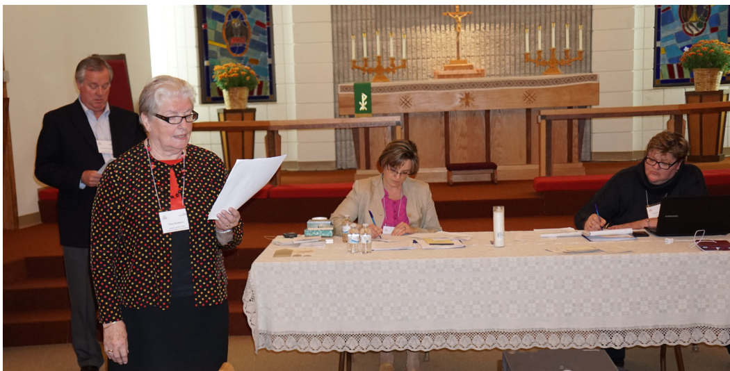
Konfernces darba gaita.