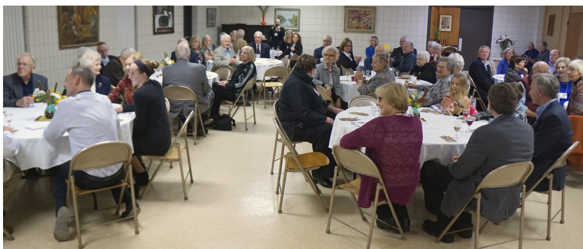
Konfernces dalībnieki un Grandrapidu draudzes locekļi satiekas saviesīgā vakarā.