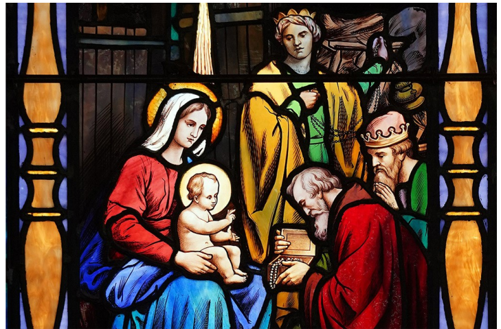
Austrumu gudrie pielūdz Jēzu. Šī vitrāža atrodas Svētās Marijas baznīcā Long Beach pilsētā uz salas, Ņujorkas štatā.

pieminēsim šos draudzei svarīgos notikumus. Epifānijas svētki pirmajos gadsimtos bija saistīti ar Ziemsvētkiem, taču 4. gadsimtā tie tika nošķirti kā atsevišķas svinamās dienas. Zvaigznes dienas izcelšanās avots nāk no Mateja evaņģēlija 2. nodaļas. Evaņģēlists liecina, ka tad, kad Jēzu ieradās pielūgt gudri vīri no austrumiem, Viņš kopā ar māti Mariju un Jāzepu dzīvoja kādā mājā. Spriežot pēc Hēroda nežēlīgās rīcības, liekot nonāvēt (Mt 2:16) „ visus bērnus Betlēmē un visā tās apkārtnē – divus gadus vecus un jaunākus, ”