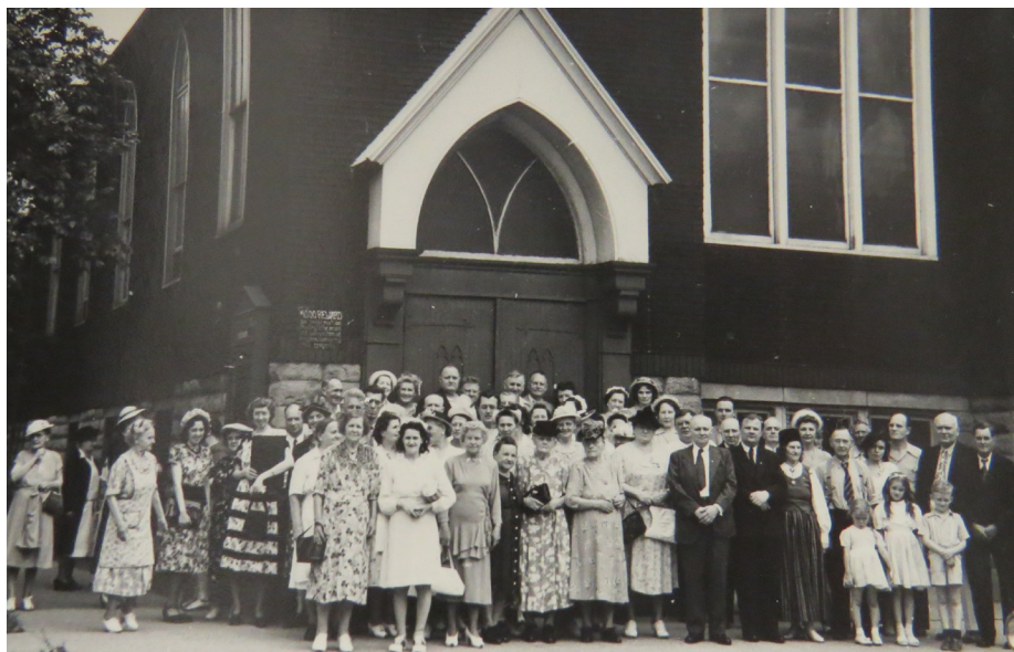
Augšā: Ciānieši savas baznīcas priekšā uz Ferdinand ielas Austin rajonā 1950s gados.

Pa labi: Ciānas vecā baznīca kāda tā izskatās šodien. Draudze vēl arvien saukta „Ciāna”, kaut gan tagad tā ir New Zion City Missionary Baptist Church .