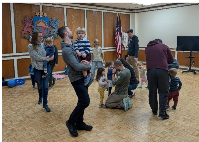
Zaķīšu grupiņas bērni ar vecākiem iet rotaļā: Lācītis ir bēdīgs

To mēs darām savā mazajā veidā — ar skolas klasītēm, dziesmām, stāstiņiem un rotaļām. Un to darāt arī jūs ar savu dāsno atbalstu un klātbūtni.