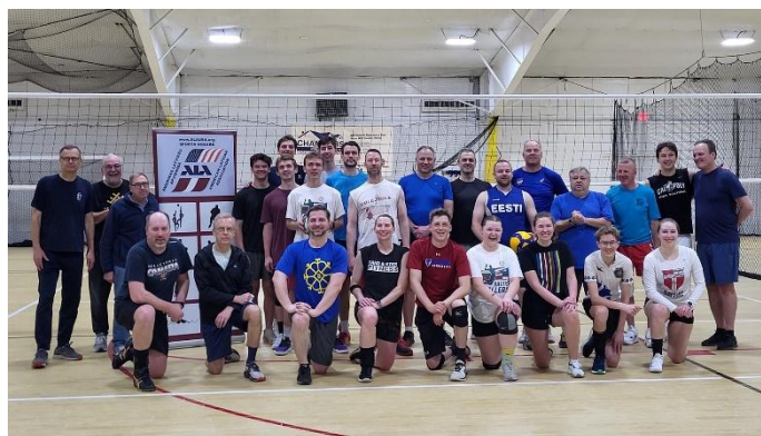
Voleja turnīra dalībnieki

spēlētāji uz vietas tika sadalīti divās komandās. Atlētiem pievienojās arī kārtīgs skaits igauņu un latviešu skatītāju, kuri spārīgi atbalstīja spēlētājus.