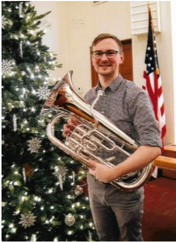
Draudzes muzikants JT