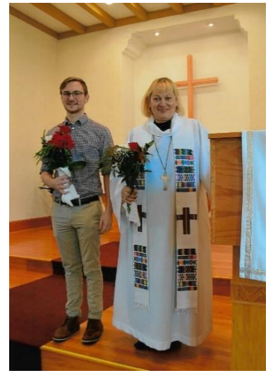
JT un mācītāja Gija