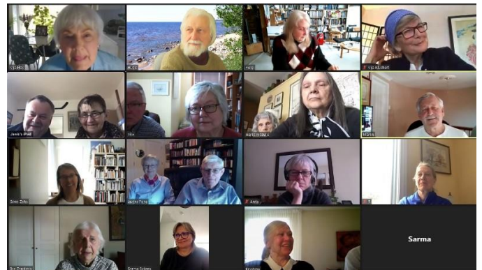
Senioru kluba Pilnsapulce, pielietojot Zoom.

18. martā noturējam Senioru kluba pilnsapulci, pielietojot Zoom.