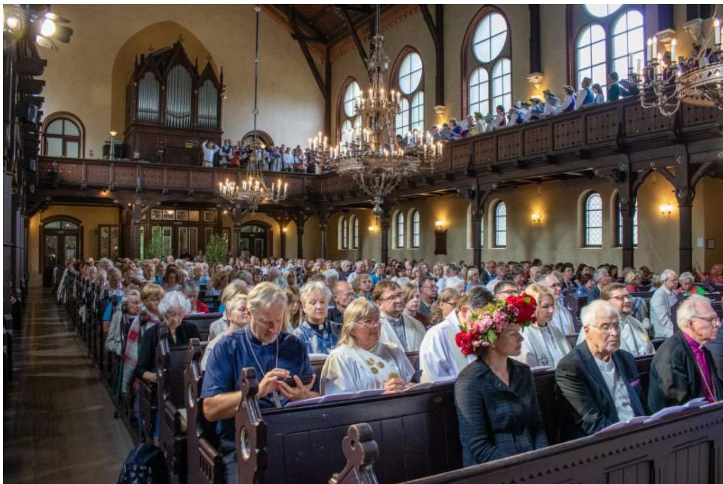
Dziesmu un deju svētku dievkalpojums Rīgas Lutera draudzes baznīcā, Torņkalnā

Par katru dāvanu, ko esat ziedojuši – pateicība! Dievs lai svētī šīs dāvanas, ka tās izmantojam Viņa vārdam par godu!